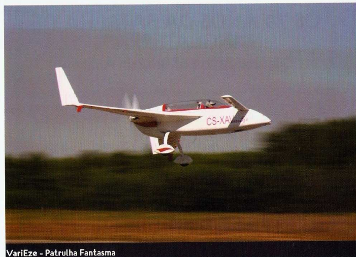
VariEze - Patrulha Fantasma

Após largos meses de preparativos, o Aeroclube recebeu de braços abertos, ao longo da manhã, todos os convidados que se deslocaram a Viseu, num dia de sol fantástico para as diferentes atracções que se seguiriam. Após a chegada das mais diversas aeronaves, as hostilidades começaram com um fraternal almoço, oferecido no hangar do ACV - Aero Clube de Viseu, para mais de 250 convidados. Após uma sentida homenagem e um minuto de silêncio em honra de um dos sócios do Aeroclube, o Cte. Sousa Monteiro, falecido a seis de Março do presente ano, foram entregues os diplomas e as asas aos novos pilotos dos cursos PPL e PU, ministrados por este Aeroclube.