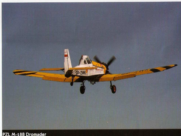
PZL M-18B Dromader

No intervalo das exhibições acrobáticas, os parapentes e os pára-quedistas viseenses pintaram o céu de várias cores, com os vários saltos que deixaram a assistência maravilhada.