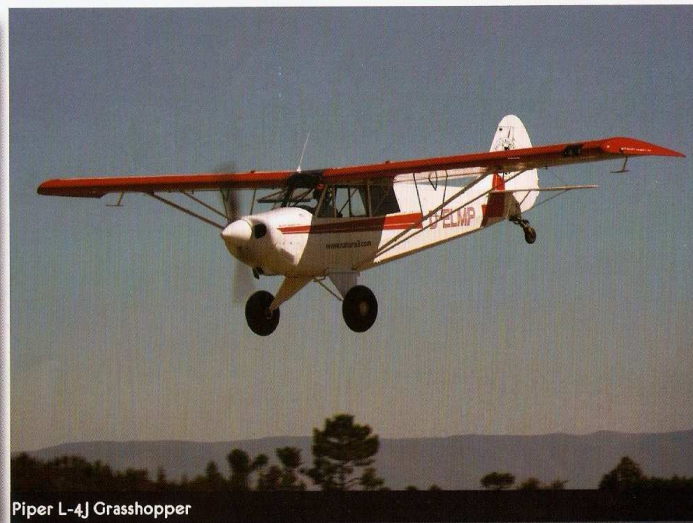
Piper L-4J Grasshopper